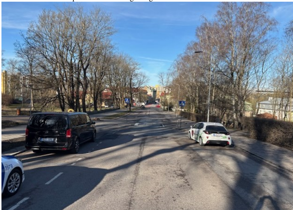
Foto nr 2. Vaade Falgi tee tasapinnalisele ülekäigurajale.