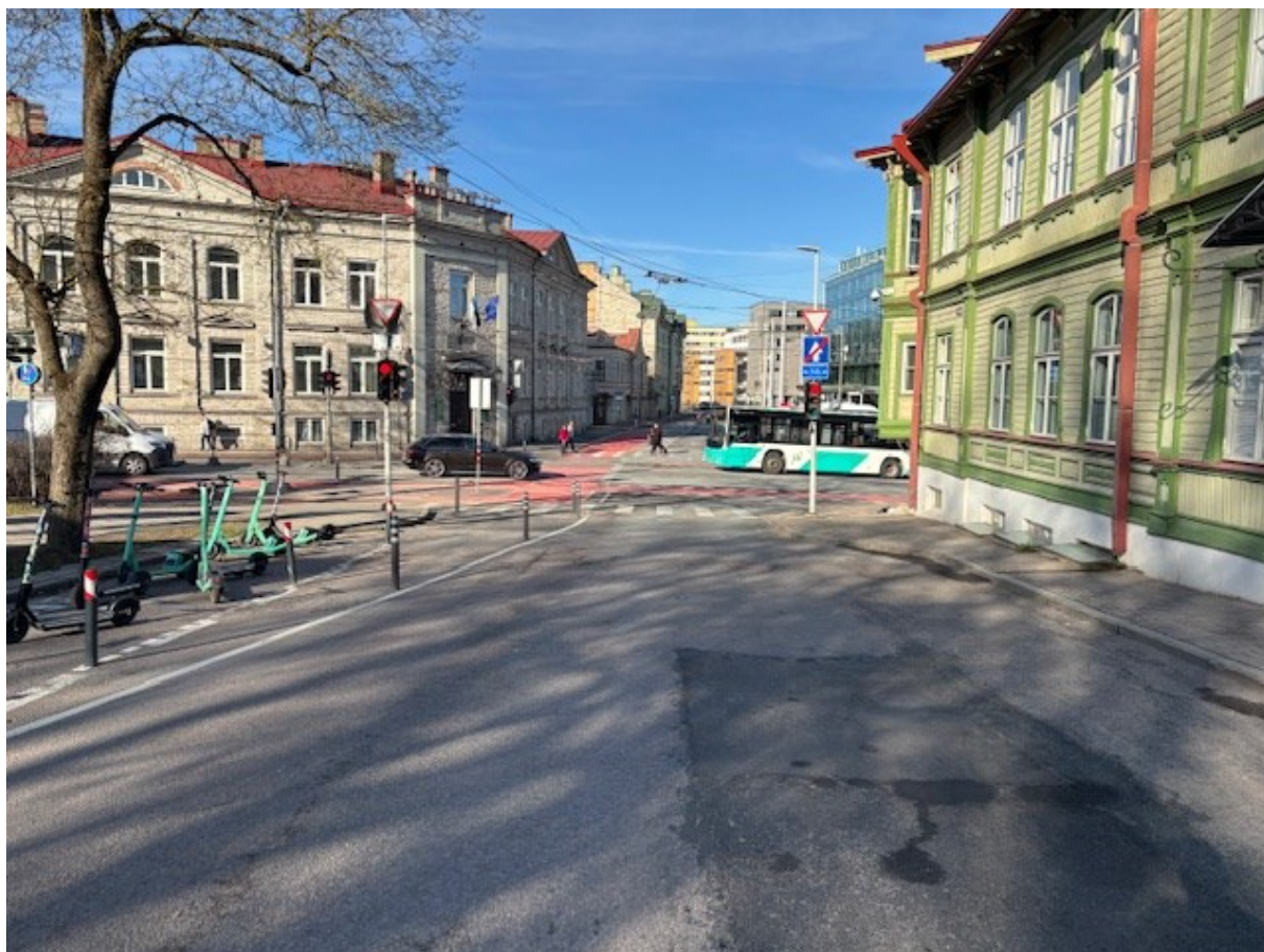
Foto nr 3. Vaade Falgi teelt suunaga Toompuiestee ristmik.