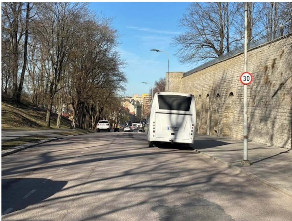
Foto nr 1. Vaade Toompea tänavalt suunaga Falgi tee.